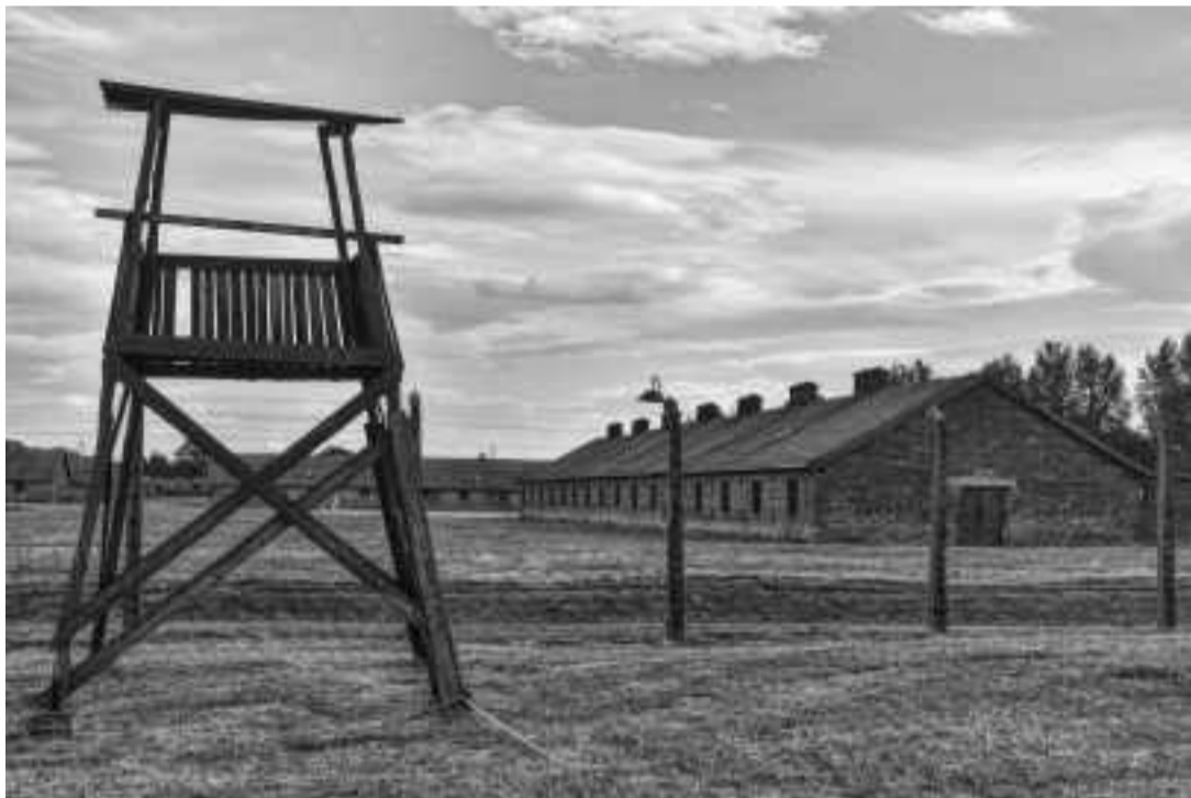
TORRE DE VIGILANCIA DE BIRKENAU