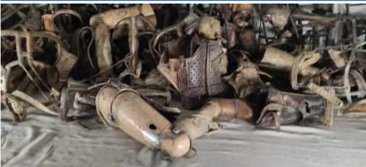
Prótesis confiscadas a los prisioneros del campo