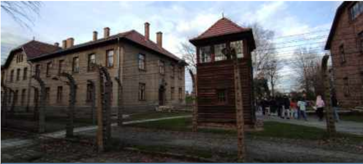
Barracones y caseta de vigilancia en Auschwitz I de Auschwitz I