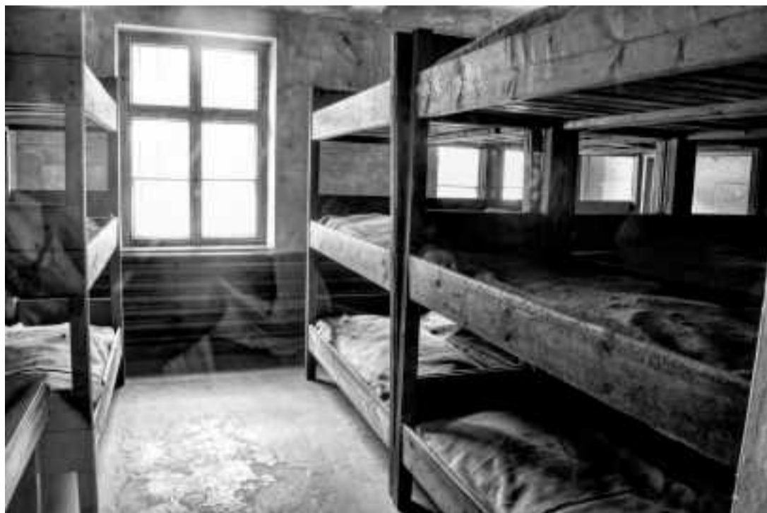
LITERAS DE AUSCHWITZ I