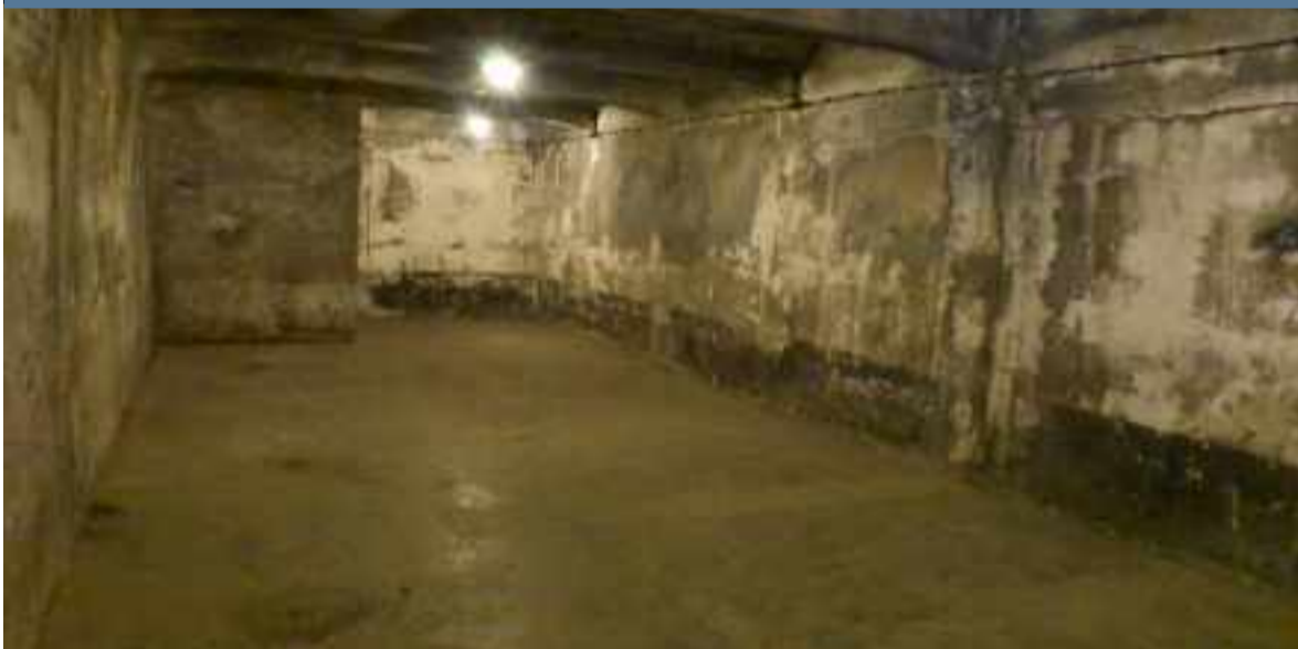
Cámara de gas en Auschwitz I