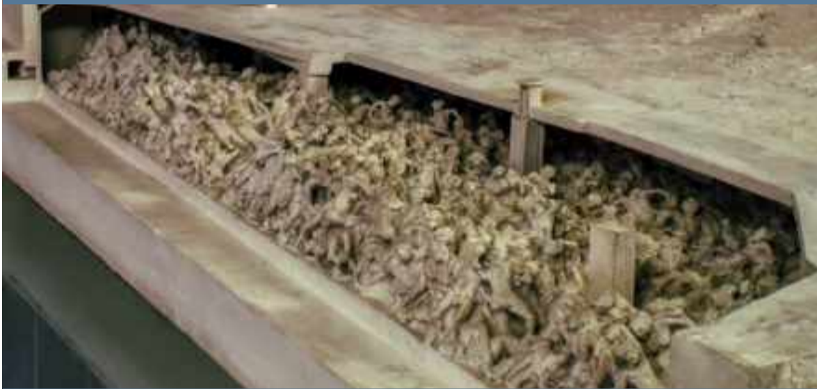
Reconstrucción del interior de una cámara de gas en Birkenau