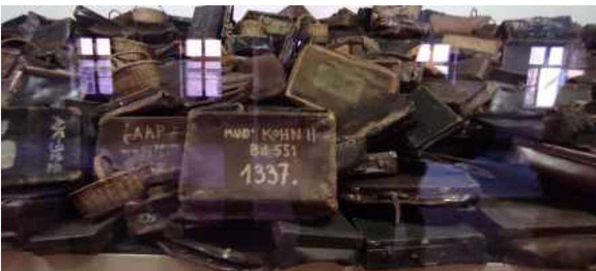
Maletas con los nombres de la familia a la que pertenecían