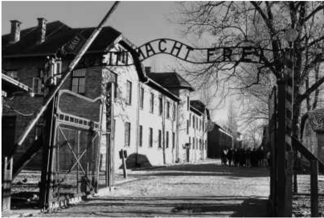
PUERTA DE ENTRADA A AUSCHWITZ I