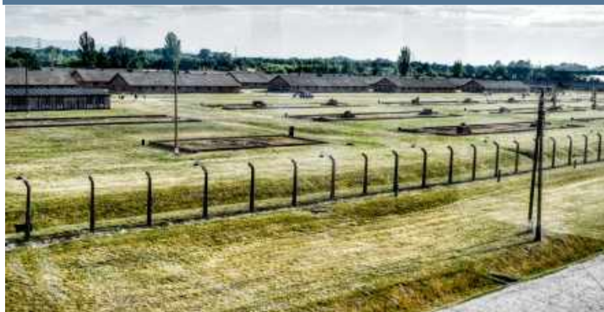
Vista general del campo de Birkenau