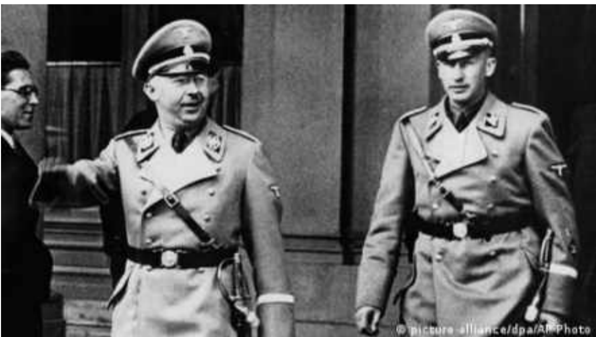
El líder de las SS Heinrich Himmler con Reinhard Heydrich el coordinador de la Conferencia de Wannsee

La conferencia fue convocada por el SS-Obergruppenführer y jefe de la Oficina Central de Seguridad del Reich, Reinhard Heydrich, con el propósito de garantizar la cooperación de los líderes administrativos de varios departamentos gubernamentales en la implementación de la llamada Solución final a la cuestión judía, por la cual la mayoría de los judíos de la Europa ocupada por los alemanes serían deportados a la Polonia ocupada y posteriormente asesinados. Asistieron a la conferencia representantes de varios ministerios gubernamentales, incluidos los secretarios de Estado del Ministerio de Asuntos Exteriores, del Interior, el de Justicia, el del Plan cuatrienal, el de Propaganda y el de los territorios ocupados del Este, así como varios oficiales de las SS. En el transcurso de la reunión, Heydrich describió cómo los judíos europeos serían detenidos y enviados a los campos de exterminio en la parte ocupada de Polonia, donde serían asesinados.