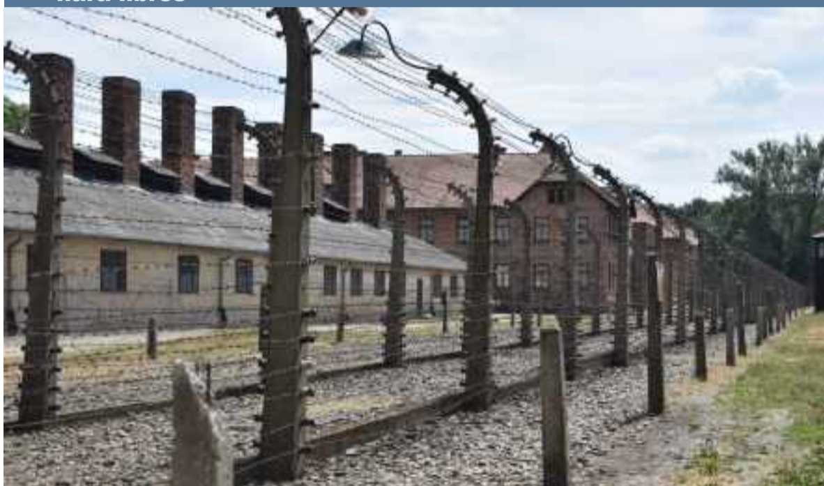
Alambradas y barracones en Auschwitz I