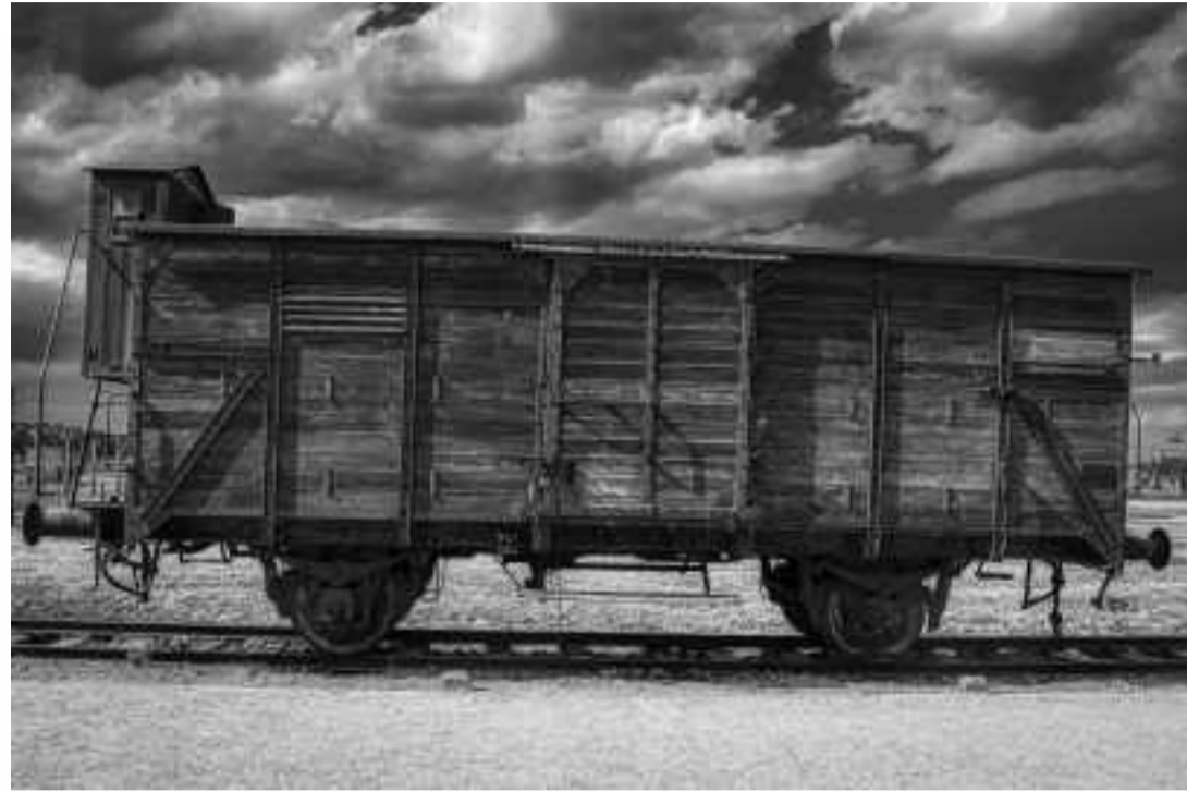
VAGÓN DE TRANSPORTE DE PRISIONEROS