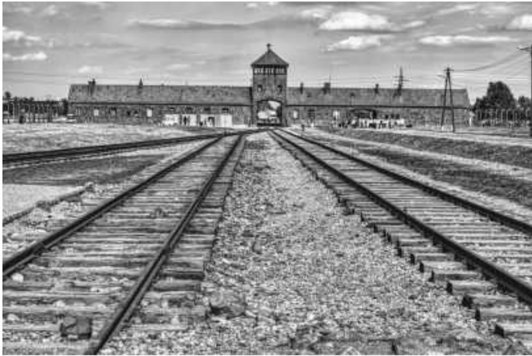
PUERTA DE ENTRADA A AUSCHWITZ I