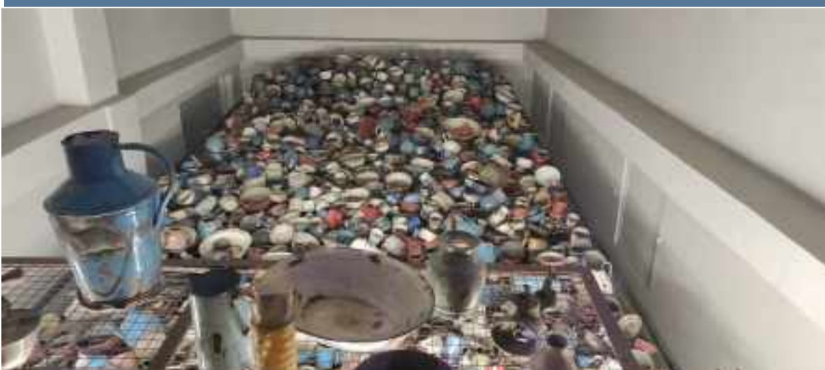
Restos de vajillas confiscadas a los prisioneros del campo