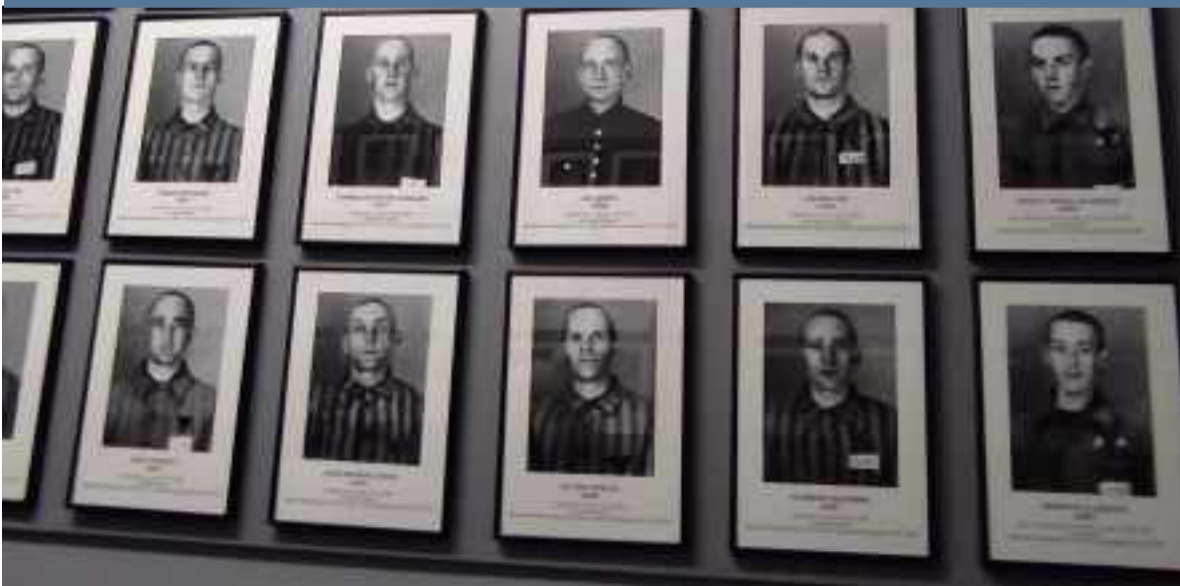
Fotos de prisioneros fallecidos en Auschwitz I

Los reclusos se despertaban al sonar un gong. Se les despertaba a las 4.30 en verano y a las 5.30 en invierno. Inmediatamente tenían que ordenar sus dependencias, intentar lavarse y hacer sus necesidades, y tomar su "café" (parte del pan negro que se les daba por la noche debía guardarse para el desayuno).