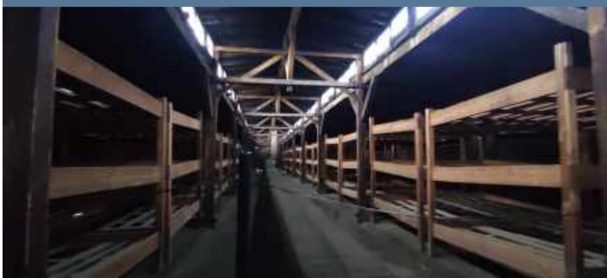
Literas en los barracones de Birkenau