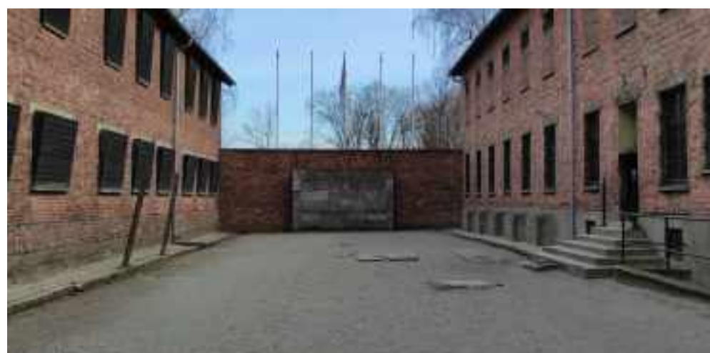
Paredón para fusilar a los prisioneros

Después de pasar lista se cenaba y a las nueve de la noche sonaba otro gong para apagar las luces y guardar silencio total. Los prisioneros dormían hacinados en largas literas, con la ropa puesta para que no se la robaran.