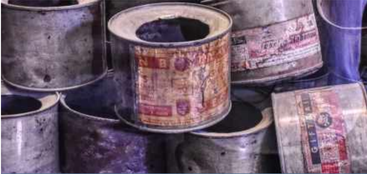
Botes de Zyklón B .