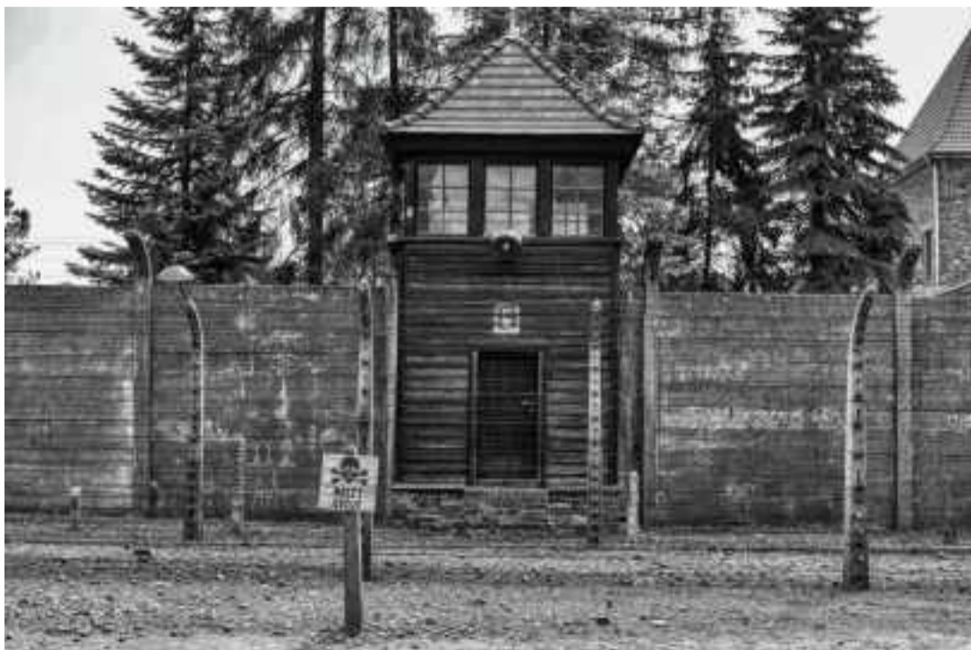
CASETA DE VIGILANCIA DE AUSCHWITZ I