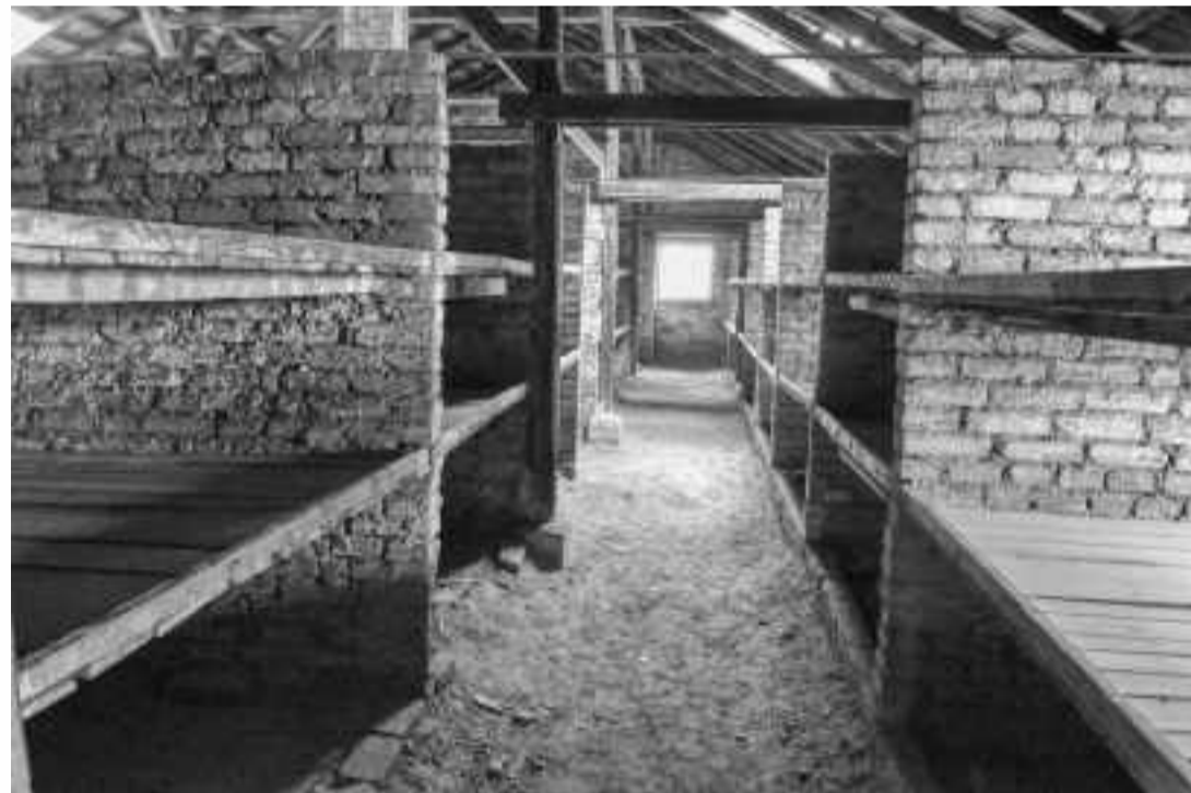
INTERIOR DEL BARRACÓN 25