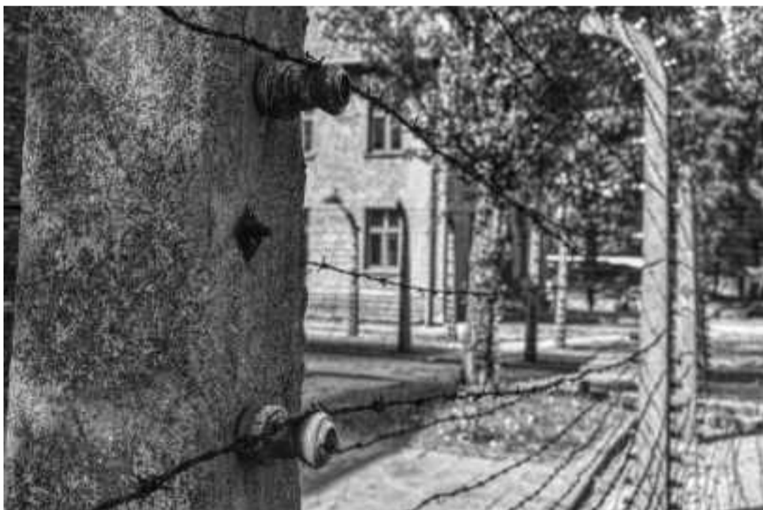
ALAMBRADAS DE AUSCHWITZ I