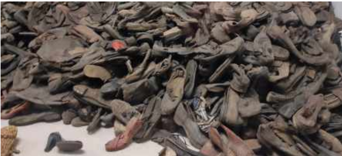
Restos de zapatos de los prisioneros del campo

Cuando Auschwitz fue liberado por el Ejército Soviético , en el campo se encontraron algunos objetos de los 1,1 millones de personas (cifra aproximada) que habían atravesado la puerta principal -sobre la que estaba el infame cartel que rezaba Arbeit macht frei ('El trabajo te hace libre')- para morir. Se encontraron 370.000 trajes de hombre, 837.000 prendas de mujer y unas 8,5 toneladas de cabello humano.