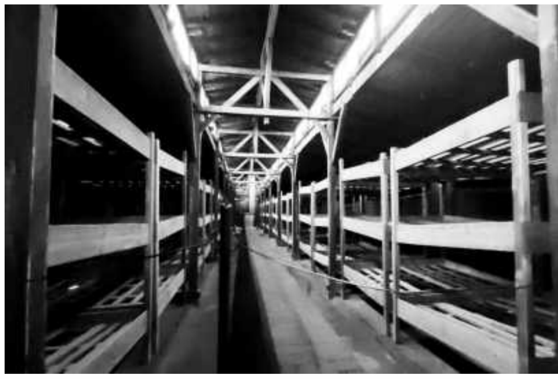
LITERAS DE BIRKENAU