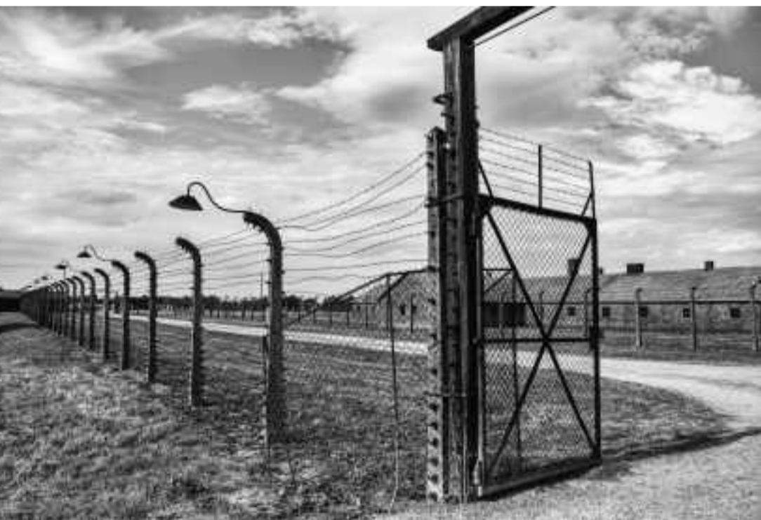
ALAMBRADAS DE BIRKENAU