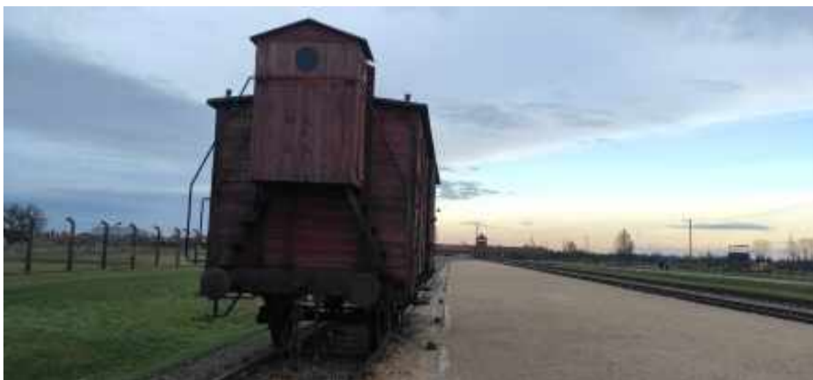
Vagón de ganado utilizado para transportar prisioneros en la rampa de selección