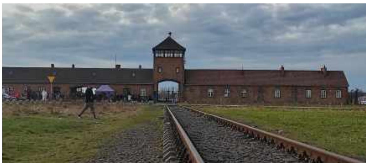
Entrada al campo de Birkenau

El gran campo de prisioneros estaba destinado originalmente a albergar a prisioneros políticos polacos -cuyo número estaba aumentando debido a una serie de arrestos masivos recientes- a los que el Mariscal del Reich, Heinrich Himmler, declaró que debían ser tratados con la "...máxima severidad".