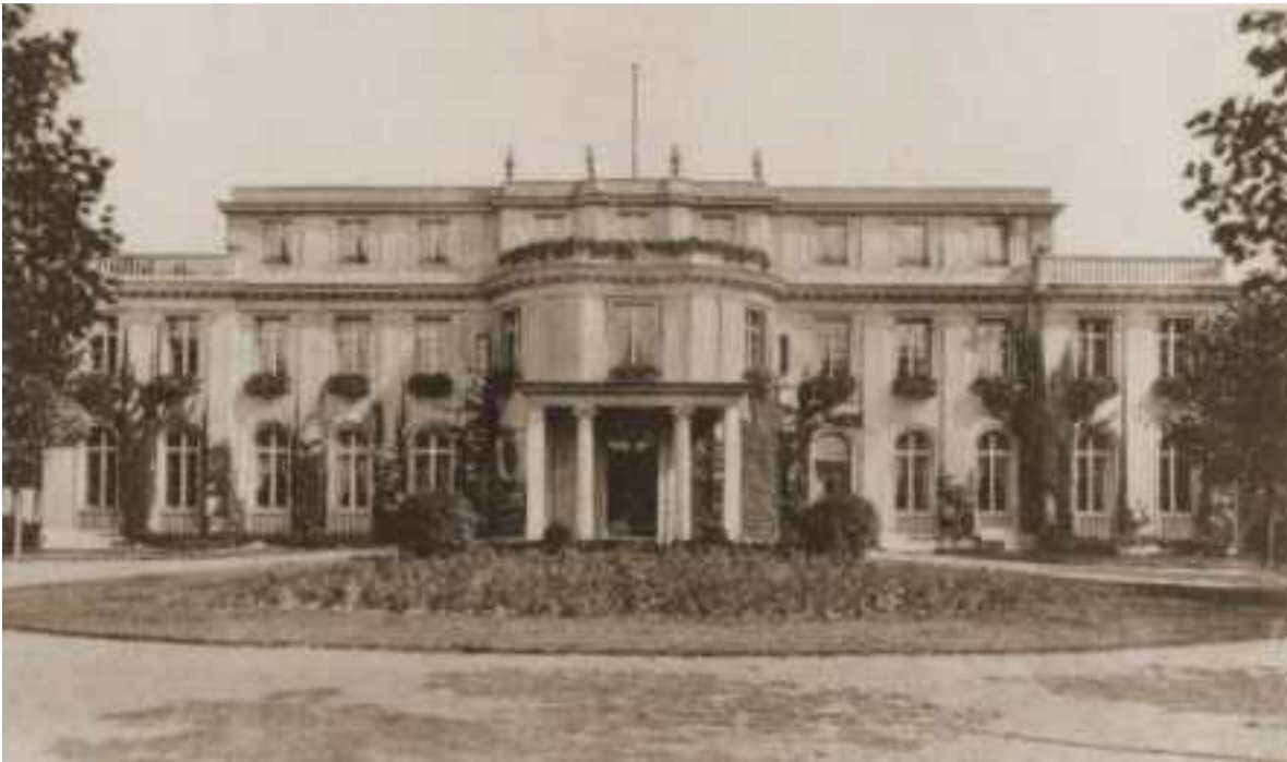
La villa Am Großen Wannsee 56-58, en donde se celebró la Conferencia de Wannsee.

La Conferencia de Wannsee (en alemán: Wannseekonferenz) fue una reunión de catorce altos funcionarios gubernamentales de la Alemania nazi y líderes de las Schutzstaffel (SS), celebrada en el suburbio berlinés de Wannsee el 20 de enero de 1942. 1