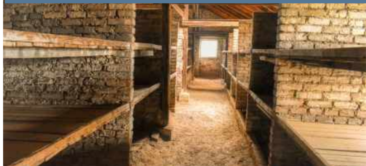
Barracon 25. Barracón especial para mujeres internas

El medio normal de entrega era un vagón de ganado de 10 metros de largo, aunque los vagones de pasajeros de tercera clase también se usaban cuando las SS querían mantener el mito del "reasantamiento para trabajar en el Este", particularmente en los Países Bajos y en Bélgica. Los vagones de carga se llenaban con hasta 100 personas y se cargaban habitualmente desde un mínimo de 150% a 200% de capacidad. Esto dio como resultado un promedio de 5,000 personas por conjunto de trenes; 100 personas en cada vagón de carga multiplicado por 50 vagones.