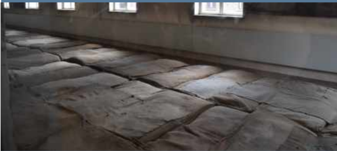
Dormitorio en los barracones de Auschwitz I