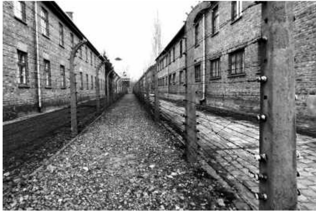
ALAMBRADAS DE AUSCHWITZ I