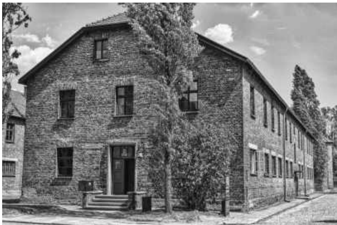
BARRACÓN DE AUSCHWITZ I