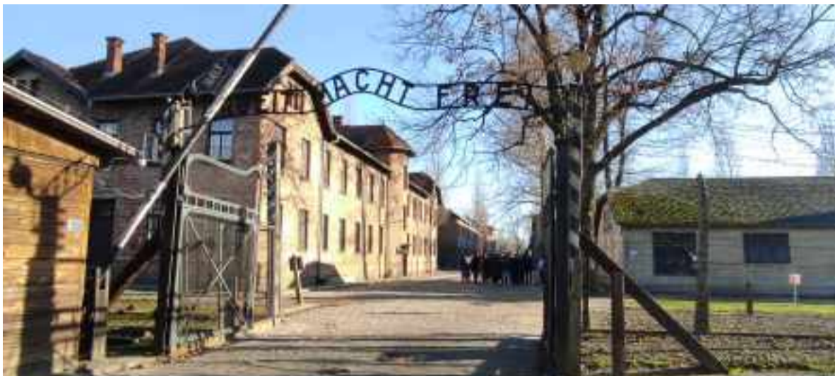
Entrada al campo de Auschwitz I con el letrero : El trabajo os hará libres